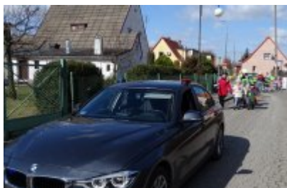
Wspólnie z najmłodszymi przeganialiśmy zimę

Na imprezie, na wszystkich czekały liczne atrakcje i konkursy. Jury wybrało najładniejszą marzanne i ufundowane, przez lokalnych samorządowców, nagrody przekazało uczestnikom konkursu.