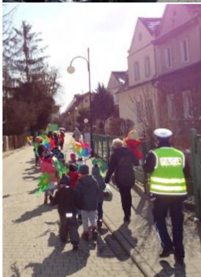
Wspólnie z najmłodszymi przeganialiśmy zimę